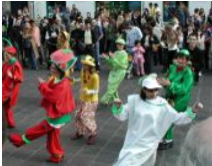
Le 5 octobre 2002 à Paris, lors des Journées Mondiales Végétariennes (JMV), la danse des fruits et des légumes. Pourquoi les végétariens se croient-ils obligés de faire les clowns, alors que le sujet dont ils parlent — le massacre de milliards d'êtres sensibles — est l'un des plus graves qui soit ?

Par son nom, évidemment, la Veggie Pride fait référence aux Gay Pride, puis Lesbian and Gay Pride, qui se déroulent dans de nombreuses villes depuis les années 1970. Je pense que