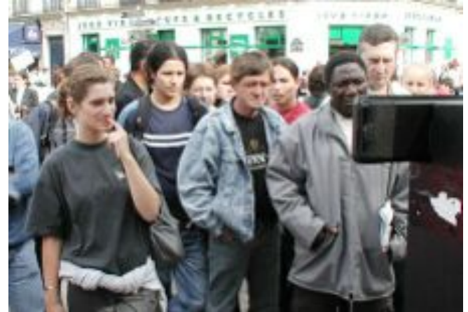
Croient-ils le public incapable de prendre au sérieux le sort des animaux ? Un peu plus loin, en marge de l'événement, une militante a exhibé quelques vidéos d'abattoir. Les passants s'arrêtaient longuement, consternés. Par leur tristesse ils étaient bien plus proches des raisons qui nous font refuser de manger les animaux que ne l'étaient les participants aux piterries officielles.

Le végétarisme n'est pas interdit par nos lois, mais tend à être considéré comme un signe de sectitude par les autorités, et, en tant que tel, subit une répression officieuse. Par ailleurs, les autorités médicales françaises mentent systématiquement au sujet du végétarisme et encore plus du végétalisme, diffusant l'idée de l'impossibilité d'une alimentation humaine indépendante de l'exploitation animale 1 . Ces avis aberrants font planer une menace légale contre les personnes qui veulent élever leurs enfants sans viande ; cela n'est pas un motif suffisant pour les leur retirer, mais fera figure de circonstance aggravante en cas de problèmes sociaux ou autres. En même temps, il sera plus difficile à ces parents de trouver des conseils pédiatriques et diététiques objectifs et adaptés, l'attitude du corps médical se cantonnant souvent au rejet. En somme, si le viandeisme n'est imposé par aucune loi écrite, sa remise en question est systématiquement marginalisée 2 .